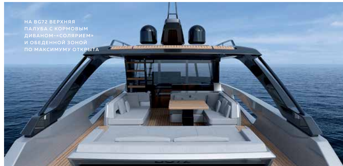
НА BG72 ВЕРХНЯЯ ПАЛУБА С КОРМОВЫМ ДИВАНОМ-«СОЛЯРИЕМ» И ОБЕДЕННОЙ ЗОНОЙ ПО МАКСИМУМУ ОТКРЫТА