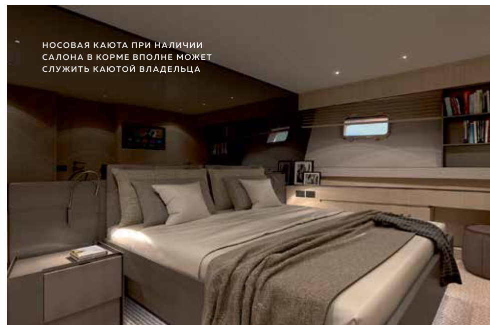
НОСОВАЯ КАЮТА ПРИ НАЛИЧИИ САЛОНА В КОРМЕ ВПОЛНЕ МОЖЕТ СЛУЖИТЬ КАЮТОЙ ВЛАДЕЛЬЦА