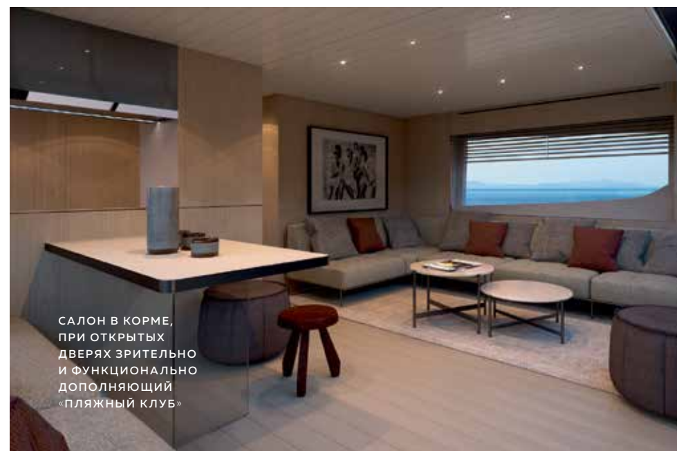
САЛОН В КОРМЕ, ПРИ ОТКРЫТЫХ ДВЕРЯХ ЗРИТЕЛЬНО И ФУНКЦИОНАЛЬНО ДОПОЛНЯЮЩИЙ «ПЛЯЖНЫЙ КЛУБ»